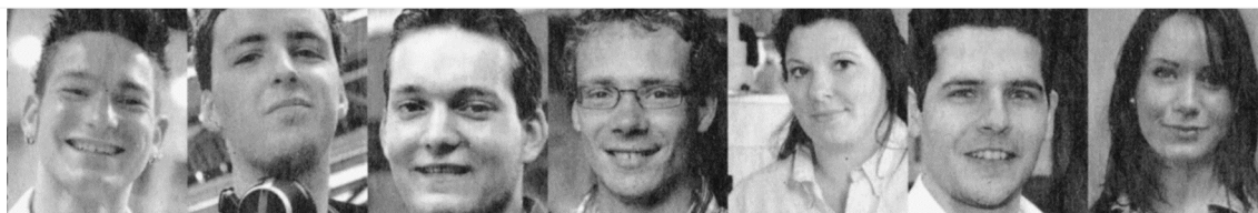
Coen Gerritse Da Vinci College