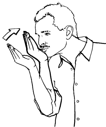
water (gebarentaal van Toearegs)