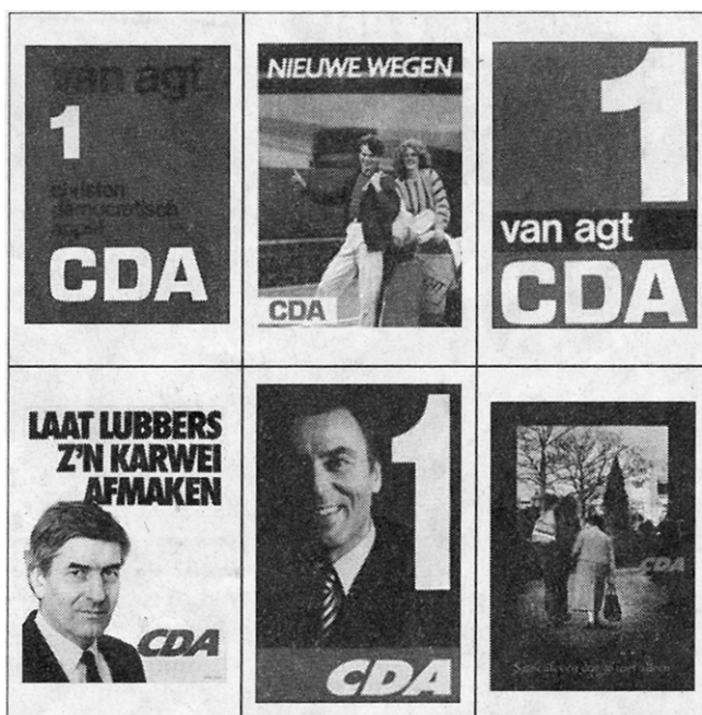
Posters van diverse CDA-campagnes.

ILLUSTRATIE UIT: CDA 25 JAAR VAN UITGEVERIJ AO (ACTUELE ONDERWERPEN) BV.