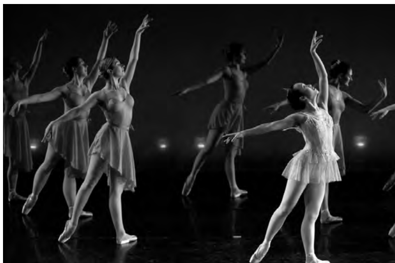
Les petits rats: c'est comme ça qu'on appelle parfois les élèves de l'école de danse de l'Opéra

L a prestigieuse école de danse de l'Opéra de Paris est en ce moment très critiquée. Selon une récente enquête, les méthodes d'apprentissage y seraient très dures, comme pour des sportifs de haut niveau.