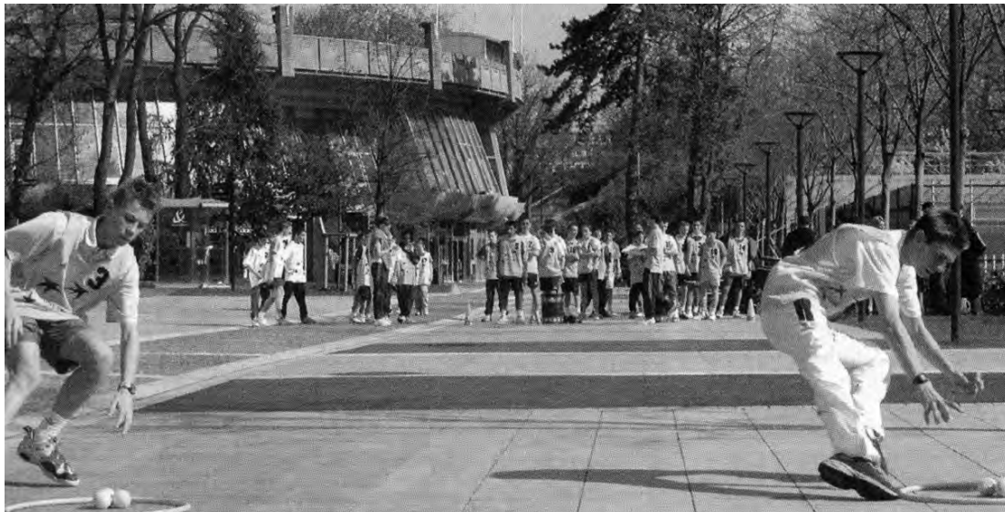
250 ramasseurs de balles 8) formés à Roland-Garros

Ils ont entre 12 et 16 ans et ont été sélectionnés officiellement pour pouvoir ramasser les balles des joueurs lors du tournoi de tennis de Roland-Garros.