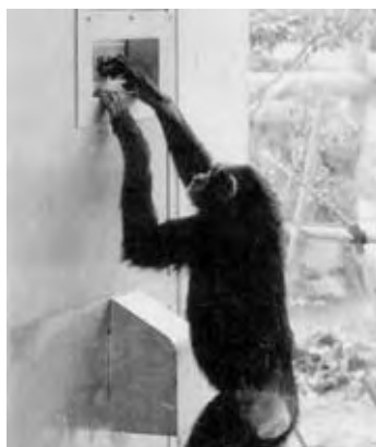
A Tokyo, la chimpanzé prodigue en pleine action. Etonnant, non?