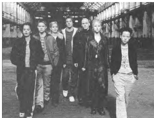
Die Clique: Sieben Jugendliche lassen sich im Kaufhaus einsperren und wollen feiern.

Die Geschichte spielt im größten Konsumtempel der Bundesrepublik. Als Vorbild fürs Film-Kaufhaus diente das Centro in Oberhau-