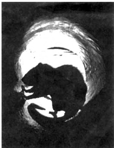
Kanalratten werden von den Städten kaum noch bekämpft.