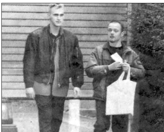
Die dümmsten Bankräuber Deutschlands waren nach dem Urteil wieder auf freiem Fuß.