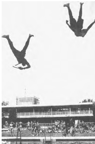
Der Moment, bevor aus Rotznasen Rothäute werden.