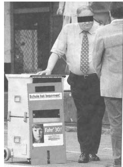
Tarnung für die Radarfalle: eine rote Briefkasten-Fassade mit einem Hinweisschild zum Schulanfang.