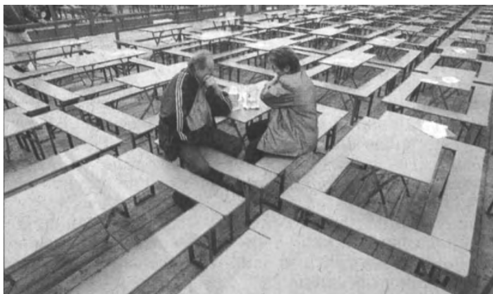
Reihenweise leere Tische. Nur wenige Leute ließen sich gestern in den Festzelten auf dem Münchner Oktoberfest die Maß Bier schmecken.