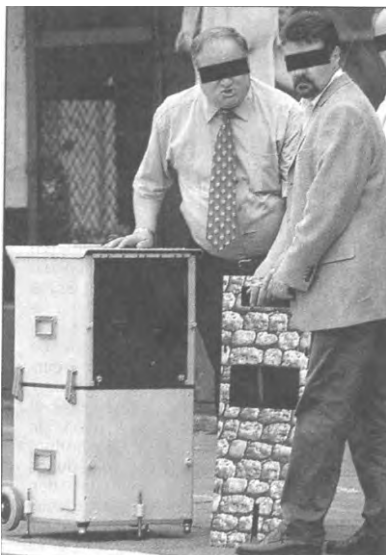
Die Chamäleon-Falle: Ein Beamter setzt eine neue Vorderfront ein – damit der Radarkasten wie ein Pfeiler aussieht.